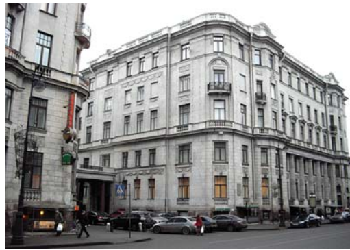
Дом, где было совершено убийство

С самого создания и до 1944 г. действовал